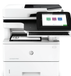
Impressora multifuncional HP LaserJet Managed Flow E52645c