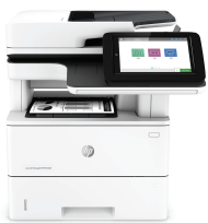
Impressora multifuncional HP LaserJet Managed E52645dn