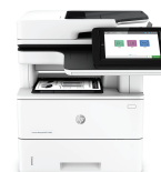
Impressora multifuncional HP LaserJet Managed E52645dn